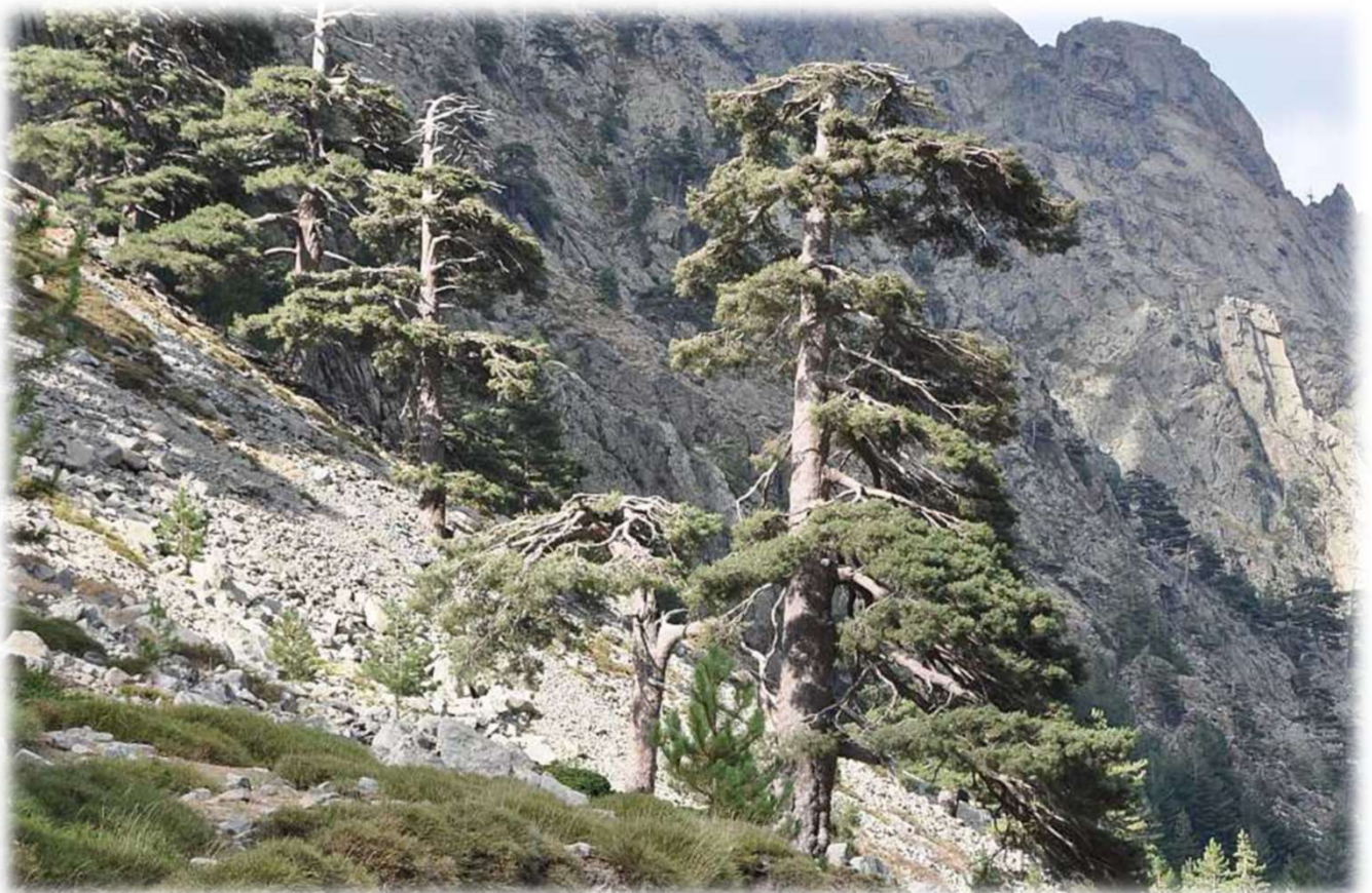
Pino laricio: portamento

Dimensioni e portamento: albero alto fino a 40 metri, più slanciato rispetto al pino nero, molto resistente alle avversità ed adattabile. La chioma ha andamento piramidale, più rada man mano che la pianta cresce, con i rami secchi che tendono a non cadere; il fusto è grigio, con corteccia a scaglie, che si trasformano poi in placche di notevoli dimensioni. Le pigne coniche sono lunghe fino a 10 cm, di colore bruno. Le foglie sono aghiformi, riunite a coppia, in fasci di colore verde scuro.