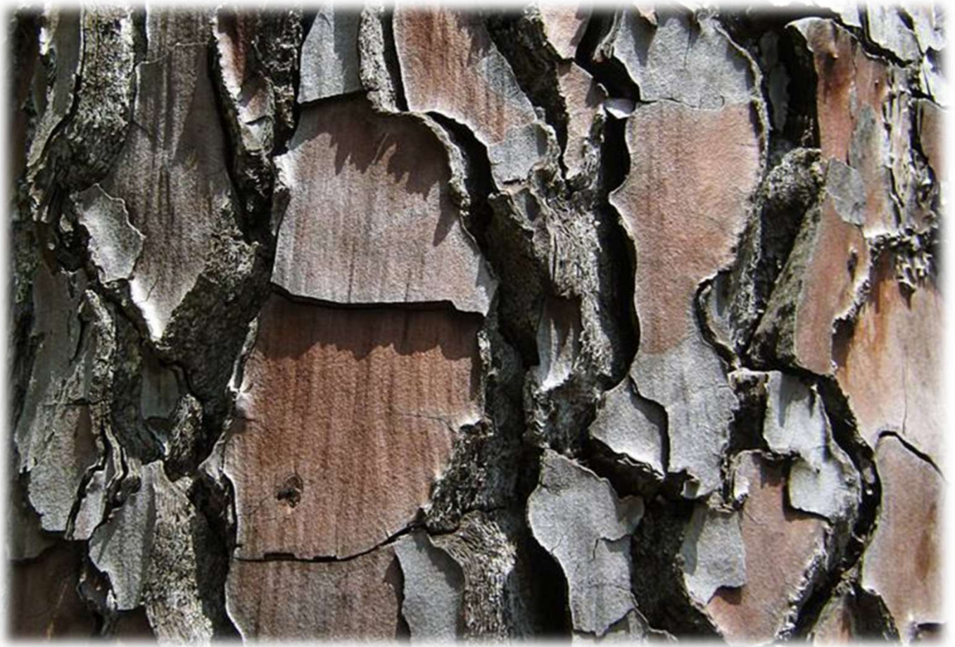
Pino laricio : particolare della corteccia

Temperatura ed esposizione: Il Pino Laricio è una conifera maestosa e frugale, che si distingue per la sua straordinaria capacità di adattamento a condizioni difficili. Predilige climi freschi ma è estremamente resistente al freddo. Come la maggior parte dei pini, è una specie eliofila, ovvero richiede un'esposizione diretta e abbondante alla luce solare per crescere correttamente.