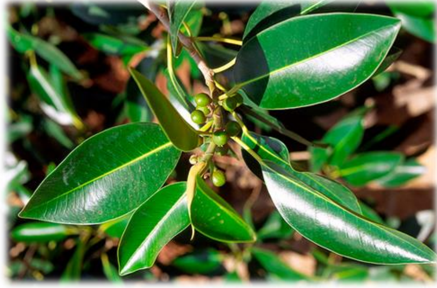
Ficus macrophylla Desf. Ex Pers.: foglie

Temperatura e irrigazioni: albero originario dell'Australia, è in grado di adattarsi bene anche al clima europeo, purché si tratti di zone caratterizzate da inverni miti. Teme le gelate, e richiede posizioni soleggiate. Necessita di irrigazioni soprattutto in estate, pur tollerando periodi di siccità in età adulta.